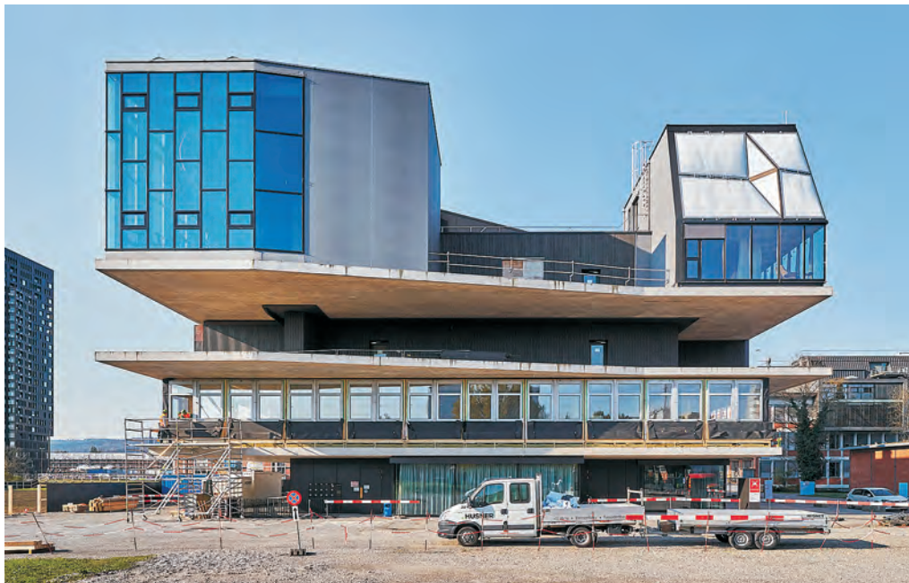
Abb. 3 NEST, Empa Dübendorf. Einbau Unit Sprint im 1.OG.

Die meisten Materialien und Komponenten stammen aus lokalen Rückbauten. Darüber hinaus wird Material aus den Vorräten der Empa selbst verwendet bzw. Material, das – bedingt durch den Umbau – direkt am NEST verfügbar wird (NEST ist ein modulares Forschungs- und Innovationsgebäude der Empa und Eawag, in dem temporäre Gebäudemodule, sogenannte ‘Units’, installiert werden können; vgl. 6). So werden Dämmung und Holzverkleidung des NEST-Gebäudekerns direkt vor Ort wieder eingesetzt. Auch anderes Dämmmaterial, das die Empa als Eidgenössische Materialprüfungs- und Forschungsanstalt auf Lager hat, wird in der Unit Sprint eingesetzt. Zwei Photovoltaik-Anlagen der Empa wird ein zweites Leben in der Fassade der Unit Sprint ermöglicht.