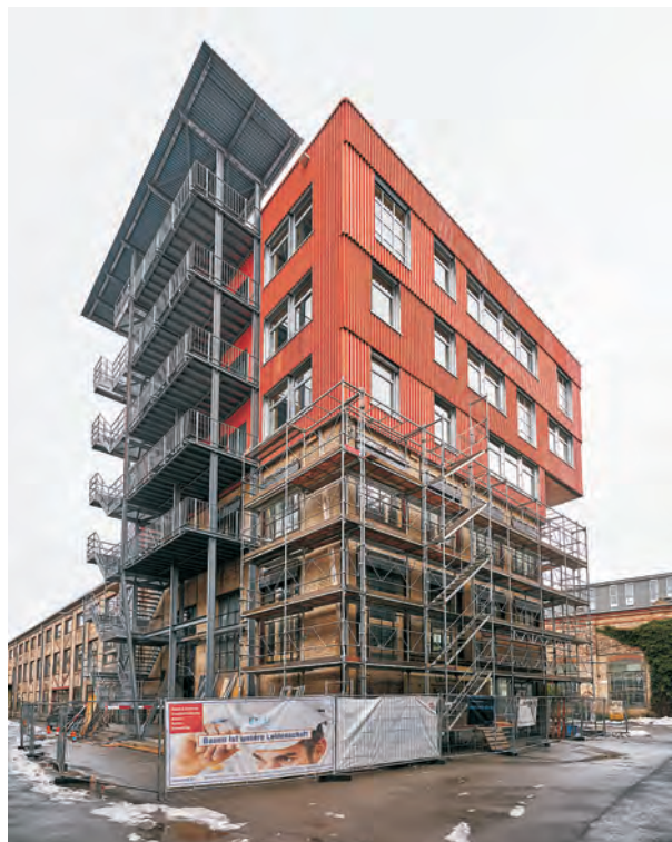
Abb. 2 Kopfbau K118, Lagerplatz Winterthur. Dreigeschossige Aufstockung aus 70 % wiederverwendetem Material.

Detaillierte Informationen zu Themen wie historische Einordnung, Akzeptanz, Verschiebung von Kosten- und Planungsleistungen im Vergleich zum Standardprozess, rechtliche Bedingungen etc. wurden erarbeitet und sind in Buchform ( Stricker et al. 2021 ) erhältlich.