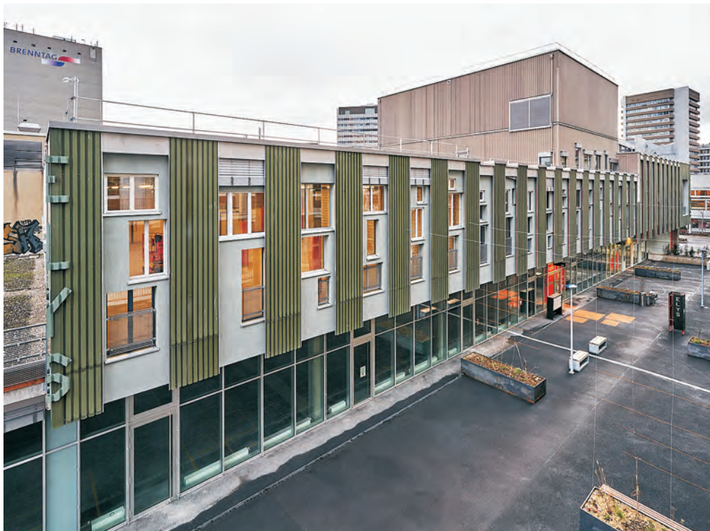
Abb. 1 Kultur- und Gewerbehause ELYS, Lysbüchel Basel. Rund 1'000 m 2 Fassade mit wiederverwendetem Baumaterial.

Durch die Wiederverwendung der Bauelemente für die neu erstellte Fassade wurden rund 90 Tonnen CO 2 eingespart. Der ökologische Haupthebel lag allerdings in dem Entscheid, das Gebäude zu erhalten statt abzureissen.