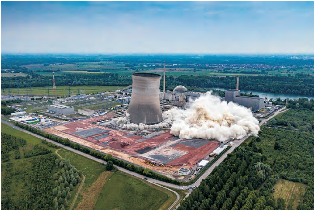
Abb. 1 Am 14. Mai 2020 wurden die beiden Kühltürme des AKW Philippsburg gesprengt, die im nördlichen oberrheinischen Tiefland bisher weithin als Landmarke sichtbar waren.

Deutschland eingeleiteten Atomausstiegs. Ende 2022 wird mit Abschaltung von Neckarwestheim II, dem letzten der aktuell noch sechs Kernkraftwerke, das Kapitel 'Atomenergie' 62 Jahre nach Inbetriebnahme des ersten Reaktors in Kahl am Main (1960) dann endgültig zu Ende gehen.