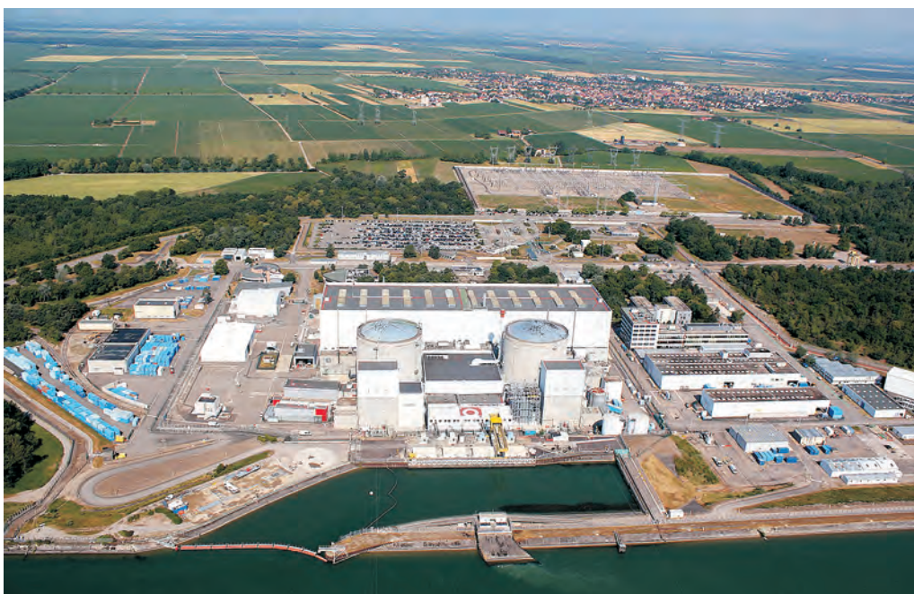
Abb. 2 Das projektierte Transformationsareal um das ehemalige AKW Fessenheim am Rheinseitenkanal, das derzeit nur über einen Gleisanschluss nach Bantzenheim verfügt und an die Route départementale D 52 angebunden ist.

Der Fokus liegt im Folgenden weniger auf dem physischen, bis 15 Jahren dauernden Rückbau der Kernkraft am Oberrhein – der Landkreis Karlsruhe hätte gerne 20 Jahre lang jährlich 1'000–3'000 t Bauschutt des AKW Philippsburg in der Kreismülldeponie Lörrach entsorgt – als vielmehr auf den zur Diskussion stehenden regionalpolitischen Umstrukturierungsstrategien für den Raum um das stillgelegte AKW Fessenheim (Abb. 2). In deren Mittelpunkt steht neben einem Gewerbe-park die Wiederherstellung der durchgehenden Eisenbahnstrecke Freiburg–Colmar. Diese sind auch in die Agenda des Vertrages von Aachen (2019) aufgenommen worden und könnten damit zu einem ersten Gesellenstück der runderneuerten deutsch-französischen Kooperation werden. Aus Sicht der Europäischen Kommission ist der Wiederaufbau der Eisenbahnbrücke über den Rhein bei Breisach ein Desideratum, das hohe Zuschüsse der EU erwarten lässt. Auch in einer 2020 vom Land Baden-Württemberg veranlassten Untersuchung zur Reaktivierung von stillgelegten Bahnstrecken, als weiterem Instrument zur Beschleunigung der Energie- und Verkehrswende, steht sie unter 42 landesweit geprüften Strecken vom Fahrgastpotenzial her an fünfter Stelle (PTV 2020, 20).