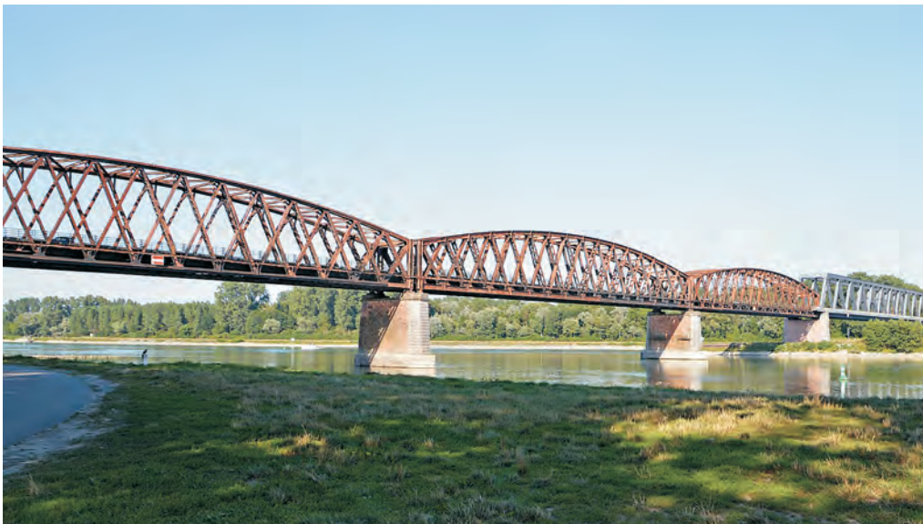
Abb. 4 Die Rheinbrücke bei Wintersdorf – Symbol der deutsch-französischen Freundschaft.