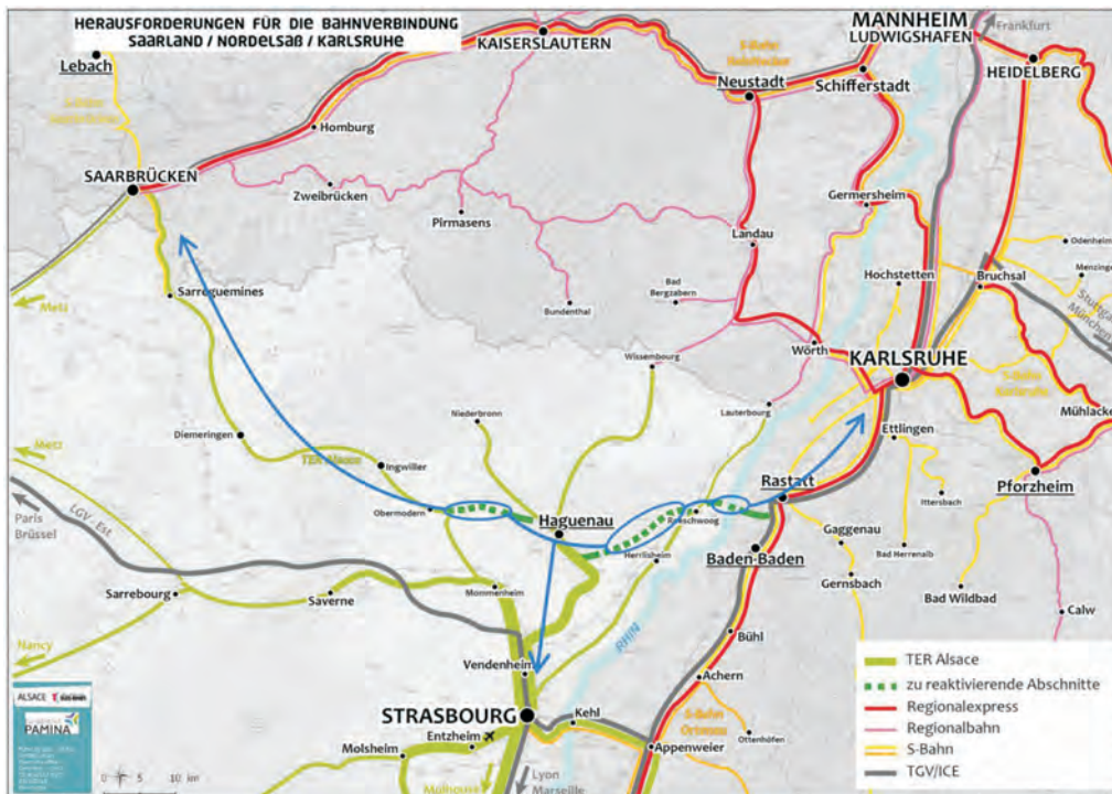
Abb. 3 Die Reaktivierung der Eisenbahnstrecke Rastatt–Hagenau hat für die Erleichterung der grenzüberschreitenden Mobilität im Eurodistrikt Paminas eine Schlüsselstellung.