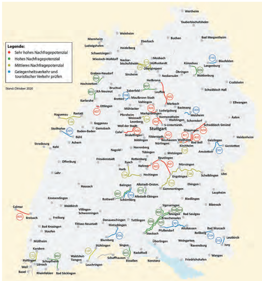
Abb. 5 Das Ergebnis der landesweiten Potenzialanalyse: Eine Übersichtskarte mit den 42 für eine Reaktivierung im Personenverkehr vorgeschlagenen Bahnstrecken.