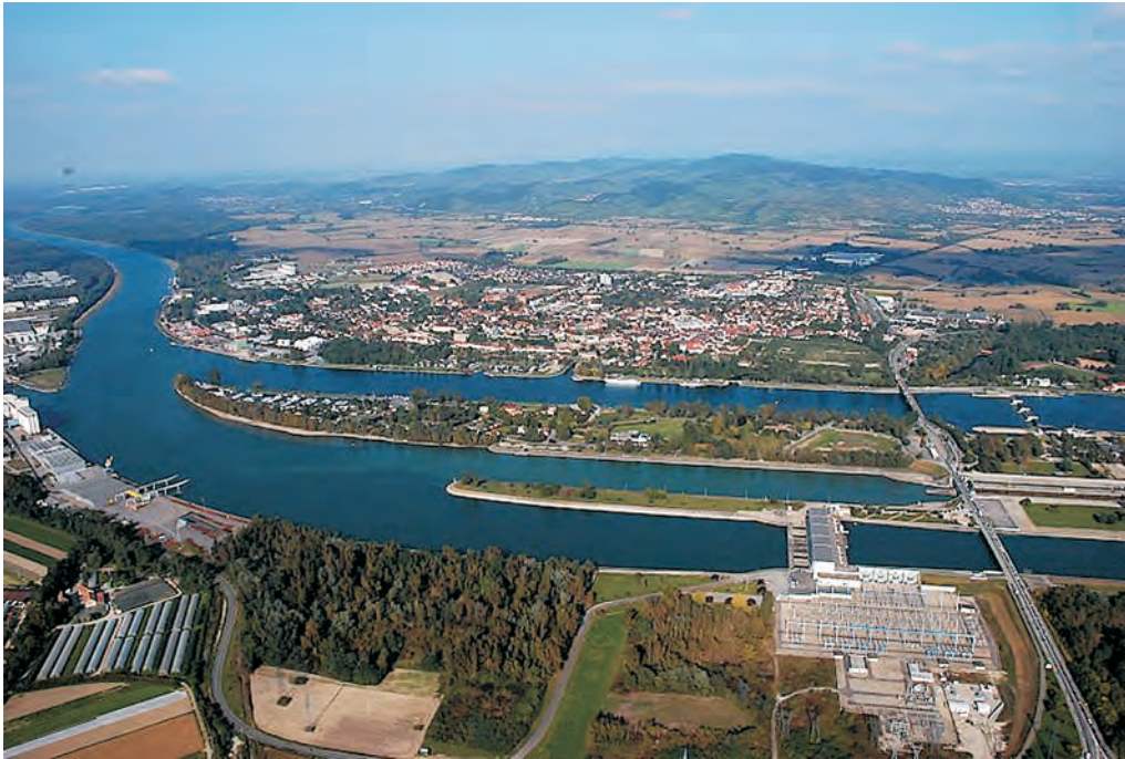
Abb. 6 Der strassenparallele Wiederaufbau der Brücke über den 1960 gebauten Rheinseitenkanal (vorne) und den Rhein sowie die Anbindung an den Breisacher Bahnhof (in der Verlängerung der Strassenbrücke rechterhand der Siedlung erkennbar) stellen die grössten baulichen Herausforderungen einer Reaktivierung der Strecke von Breisach nach Colmar dar.

die zum 1. Januar 2021 von der Stadt Messkirch und der Gemeinde Sauldorf übernommen wurde und aktuell für sonntäglichen Tourismus sowie Holcim-Zement-Züge aufgerüstet wird, perspektivisch als weitere Zulaufstrecke für den Alpentransit dienen, nämlich vom 2005 in Betrieb gegangenen Container-Terminal Ulm via Zürich (216 km)–Chiasso nach Busto-Arsizio. Darüber hinaus sind am Hoch- und Oberrhein Machbarkeitsstudien zur Reaktivierung der Wehra- und Kandertalbahn vergeben worden.