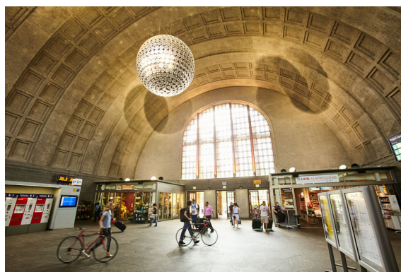
Abb. 2: Badischer Bahnhof, Schalterhalle