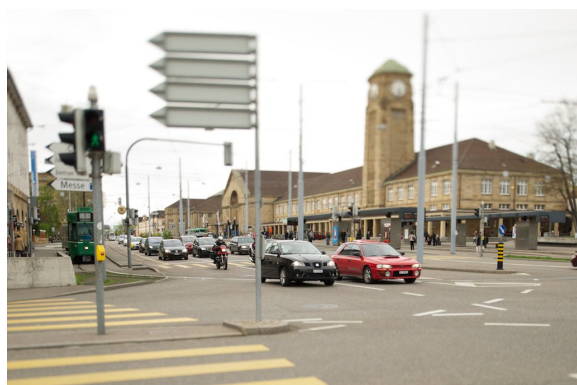
Abb. 1: Badischer Bahnhof, Aussenansicht

Auf unserer Exkursion werden einleitend Experten der Deutschen Bahn einen Einblick in die Geschichte und den Betrieb dieses einmaligen Bahnhofs geben. Anschliessend wird die Koordinationsplattform der Bestellbehörden der trinationalen S-Bahn Basel «trireno» die Entwicklungsschritte der «Trinationalen S-Bahn Basel» präsentieren. Eine einstündige Besichtigung hinter die Kulissen des Badischen Bahnhofs rundet den Nachmittag ab.