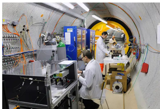
Abb. 4: Felsenlabor